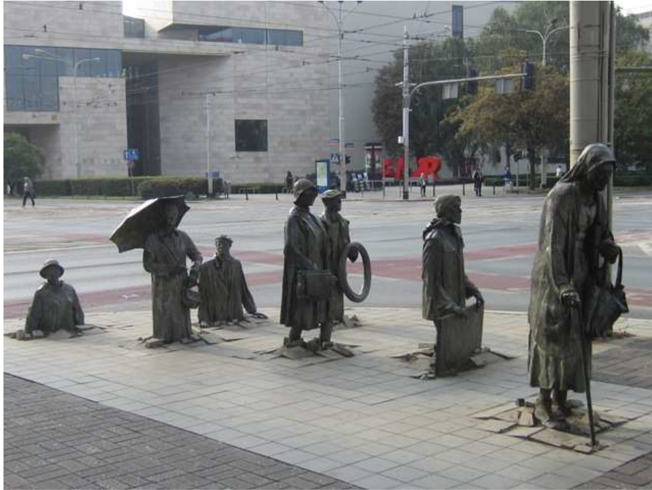
En installation i gatukorsningen närmast mitt hotell – en bild av gårdagens och dagens Polen?