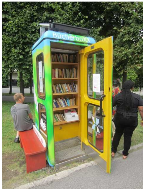
En bibliotekskiosk med solpanel på taket

När jag registrerade mig på kongressområdet fångades jag genast in och intervjuades av en reporter från polsk TV - kul. Efter den rivstarten passade jag på att orientera mig i omgivningarna, läste igenom det digra programmet och markerade i kongress-appen vilka program och event jag skulle gå på innan det var dags för Nordic Caucus.